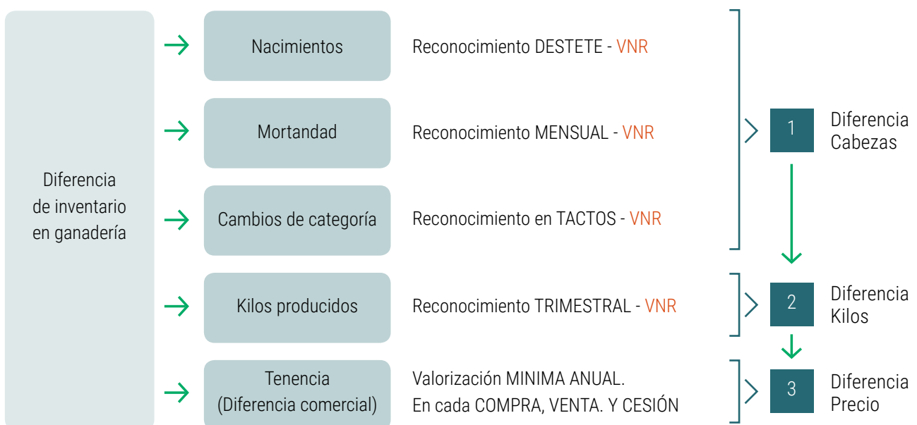
Figura 1. Proceso de cálculo de la diferencia de inventario en ganadería.

El siguiente esquema muestra la apertura que tendrá la anterior diferencia de inventario y el proceso en el que se deben ir generando los diferentes resultados.