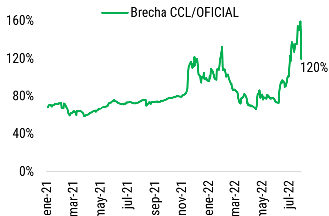
Evolución de la brecha – en porcentaje.